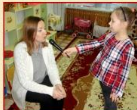
Играем в журналистов