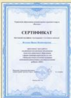
Участие в РМО педагогов ДОО ГО «Вуктыл»